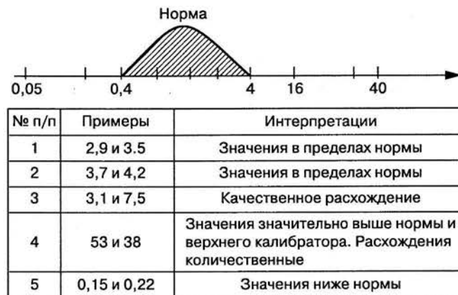
Рис. 1. Возможные результаты сравнения двух тестов (на примере ТТГ).

Сравнение результатов тестирования индивидуальных образцов неравномерно без учета неопределенности измерения, особенно если речь идет о значениях концентраций аналитов, близких к пограничным (рис. 1). Из приведенных на рис. 1 примеров истинным расхождением можно считать лишь пример № 1, когда один результат находится в нормальном диапазоне, а другой – повышен. Примеры № 1, 4 и 5 демонстрируют качественное совпадение результатов. Необходимо учитывать, что при измерении и сравнении содержания аналита в концентрациях, находящихся выше верхнего калибратора (в данном примере 16 мкМЕ/мл), образец требует предварительного разведения и учета в дальнейшем фактора